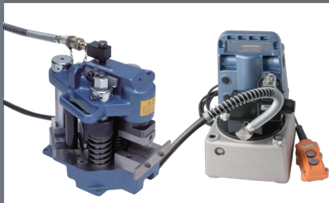
油圧ポンプとの使用例